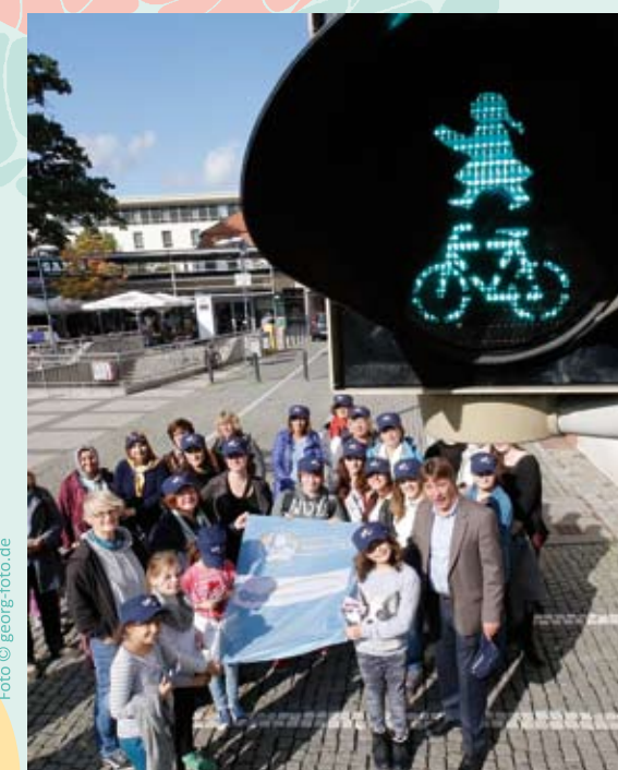
Offenbach erhält die erste Ampelfrau – Eine Aktion zum Internationalen Mädchentag 2015.